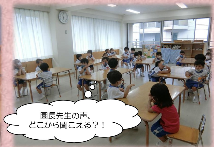
園長先生の声、どこから聞こえる?!