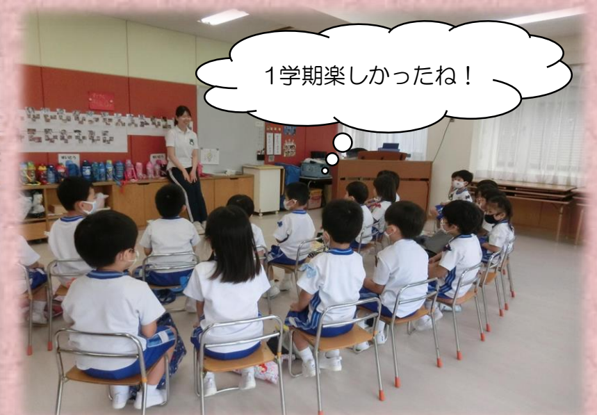
1学期楽しかったね!

コロナウイルス感染予防のため、今回は放送での終業式となりました。年少さんにとっては初めての終業式。放送で聞こえる園長の声が不思議だったようで、声が聞こえる方向を「どこどこ?」と探している姿もあり、初々しくてかわいらしいな、と思いました。園長からは夏休み中の約束事やご褒美の話、各クラスのあつまりでは1学期を振り返り、楽しかったことや嬉しかったことをみんなで共有しながら2学期がさらに楽しみになるように過ごしました。