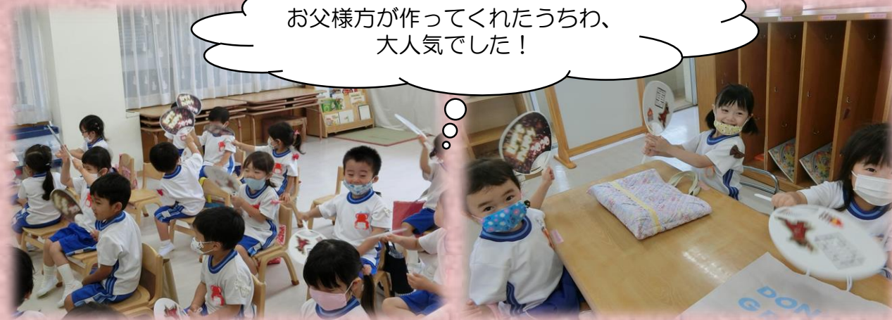
お父様方が作ってくれたうちわ、大人気でした!