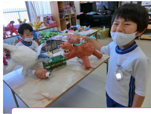
いろいろなクラスの友達とも・・・