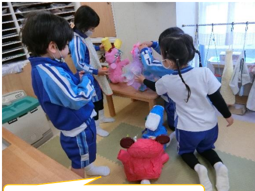
おままごとと一緒に・・・