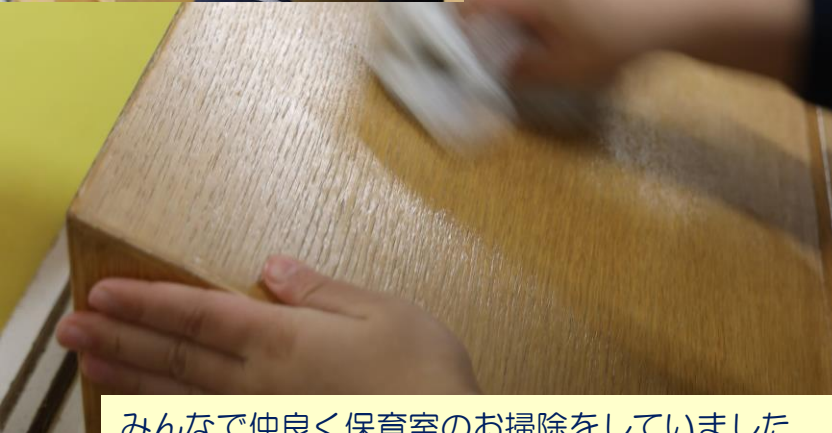
みんなで仲良く保育室のお掃除をしていました